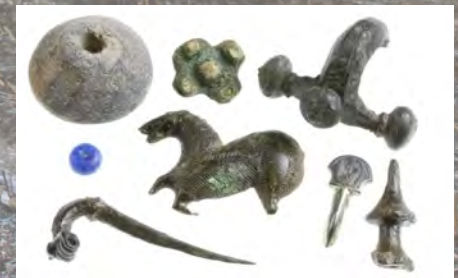
Unten: Fundauswahl des Ufermarktes Elsfleth-Hogenkamp