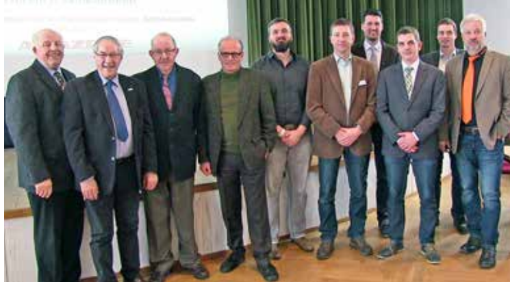
Referenten und Vorstandsmitglieder auf dem 21. Brandenburger Düngetag (Prenzlau, 31. Januar 2017)