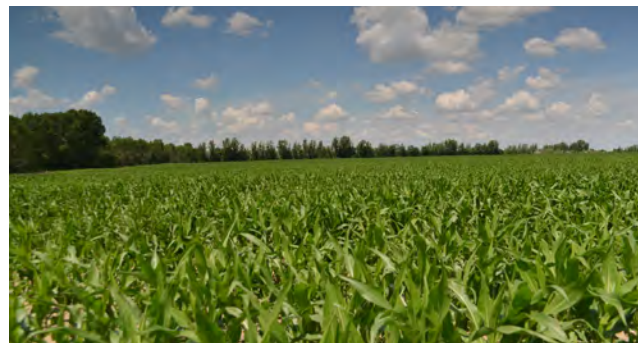
Mitteldeutsches Braunkohlenrevier: Ackerbau auf Lehmsand; ehemaliger Tagebau ‚Peres‘

Auf Rekultivierungsflächen mit bindigen (lehmigen) und nährstoffreichen Kipp-Substraten ist eine dauerhafte landwirtschaftliche Folgenutzung möglich. Im Mitteldeutschen und auch im Rheinischen Braunkohlenrevier prägen daher landwirtschaftliche Nutzungsformen die Bergbaufolgelandschaften.