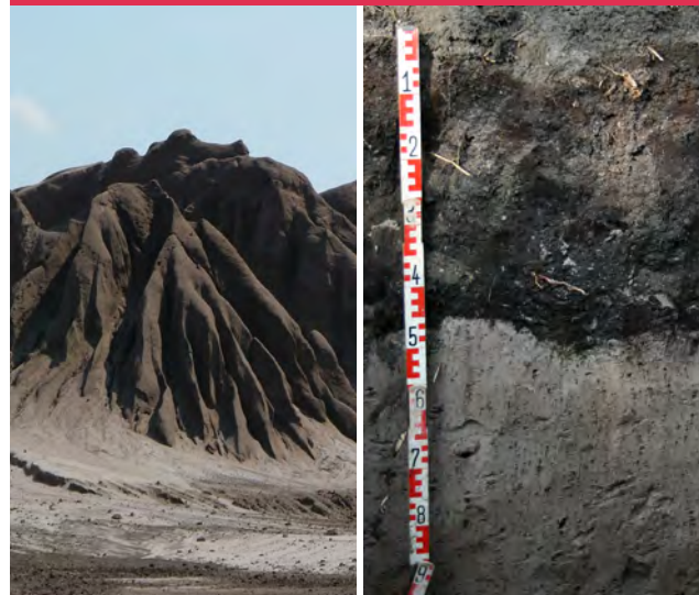
Regosol unter forstlicher Nutzung

Kipp-Regosole aus Sand besitzen häufig ein geringes Nährstoff- und Wasserspeichervermögen, sind aber gut durchwurzelbar und gut wasserleitend. Bedingt durch die Verkippungstechnik können auch höhere Anteile an kohligen Bestandteilen vorkommen. Diese verbessern zwar die Nährstoff- und Wasserspeichereigenschaften, führen aber oftmals auch höhere Anteile an schwefelhaltigen Mineralen (Pyrit und Markasit). Durch deren Oxidation entwickeln sich innerhalb kurzer Zeit eisenoxidreiche, sulfatsaure Kippenböden mit pH-Werten weit unter 3 (Essig). Um sie nutzbar zu machen, bedarf es einer intensiven Bodenverbesserung mit sehr hohen Kalkgaben und einer zielgerichteten Düngung. Sonst bleiben sie über Jahrzehnte ohne Bewuchs.