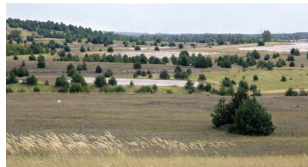
Kippen-Landschaft im NABU-Naturparadies Grünhaus

Kippenflächen mit kleinflächigem Substratwechsel werden nicht oder nur geringfügig melioriert. Solche Areale mit großer Heterogenität ökologischer Bedingungen auf engem Raum bleiben meist sich selbst überlassen. Sie bieten für Pflanzen und Tiere ein Mosaik unterschiedlichster ökologischer Nischen, die in unserer stark genutzten „Kulturlandschaft“ kaum mehr zu finden sind. Sie können für den Arten- und Biotopschutz wertvoll sein.