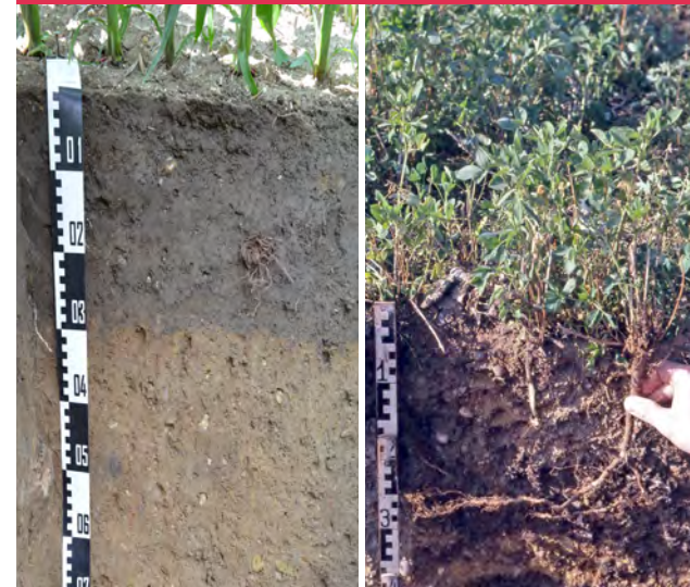
Luzernewurzeln nach Schadverdichtung

Eine spezielle landwirtschaftliche Rekultivierungsfruchtfolge mit tiefwurzelnden, Stickstoff sammelnden und Gefüge verbessernden Einsaaten fördert in den ersten Jahren eine intensive und tiefgründige Humusanreicherung.