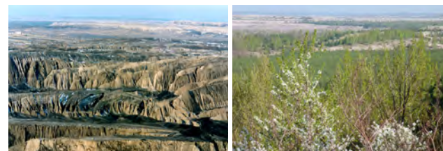
Kippe des Tagebaus ‚Klettwitz‘, Lausitz, vor Beginn der Sanierung 1995 und 2018

Die Wiederherstellung von funktionierenden Ökosystemen auf den vom Bergbau hinterlassenen Flächen ist eine wahre „Herkulesaufgabe“. Mit langem Atem, dem nötigen Sachverstand und dem Engagement aller Beteiligten können aus zerstörten Fluren wieder neue, vielfältig nutzbare Landschaften und multifunktionale Böden entstehen.